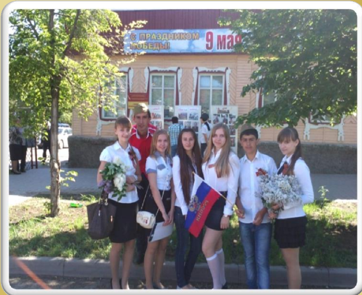
Участие в параде, посвященном Дню Победы