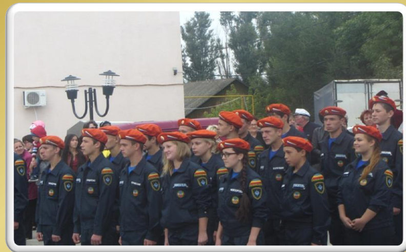
Участие класса в мероприятиях, посвященных 270-летию ст. Обливской