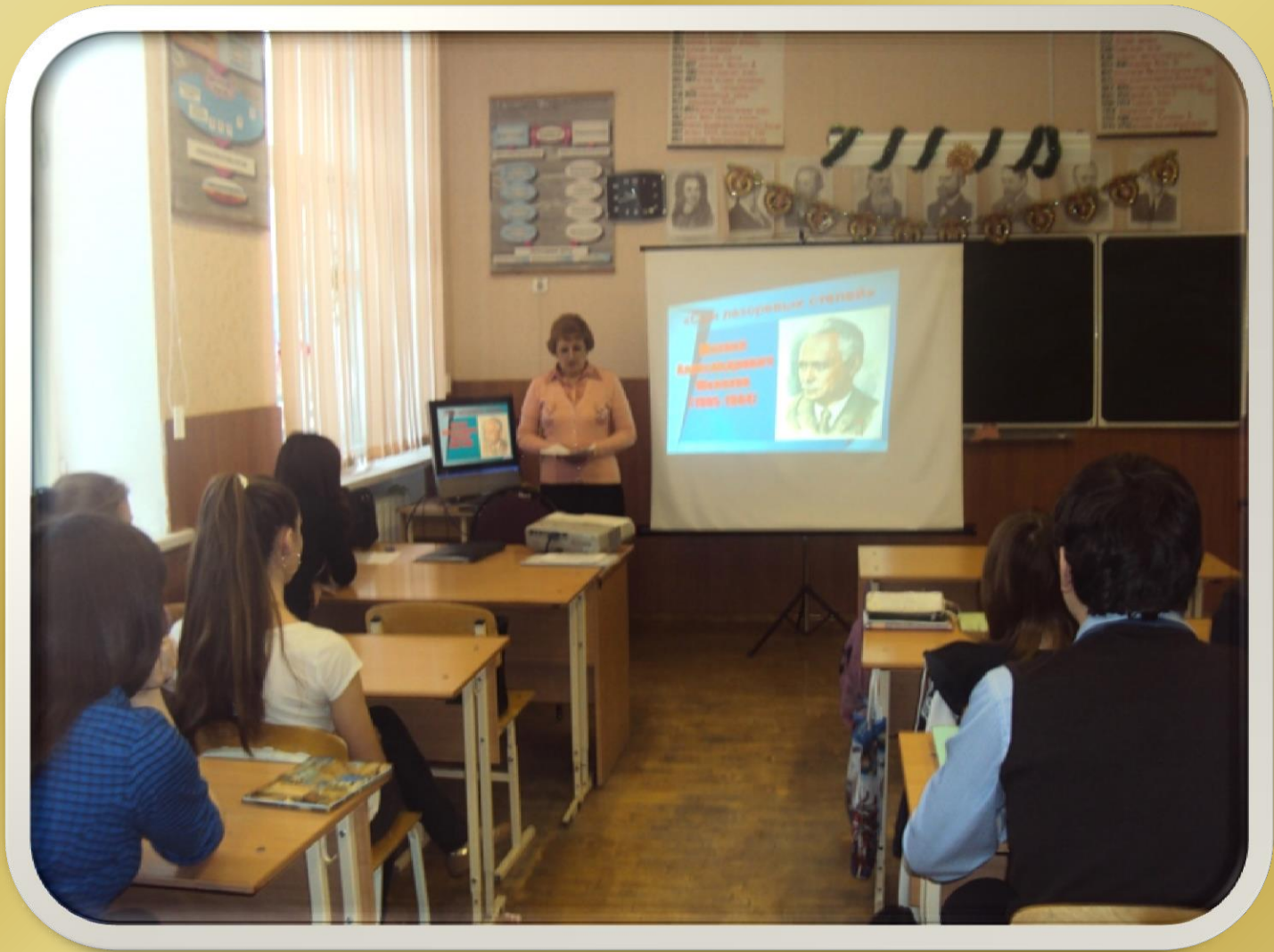
Война на страницах произведений М.А.Шолохова